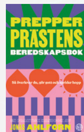
Prepperprästens beredskapsbok Jonas Ahlform