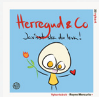
Vykortsbok Royné Mercurio